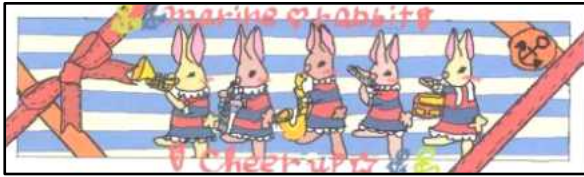
片面 最多得票 作品