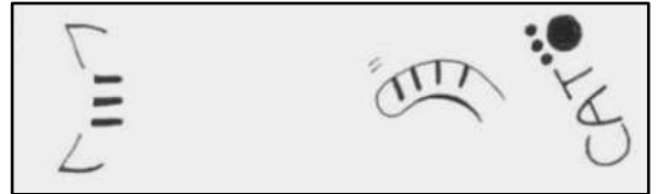
両面 最多得票 作品

最多得票以外の作品も簡易しおりにして貸出の際のプレゼントにしています。 沢山の利用お待ちしております。